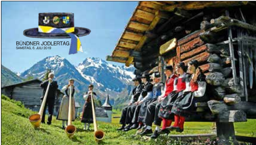
BÜNDNER JODLERTAG SAMSTAG, 6. JULI 2019