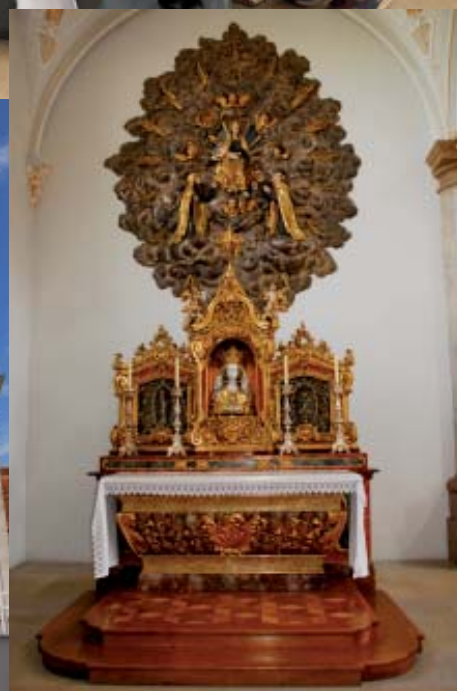
Fotoimpressionen: Pfarreiwallfahrt 2009 nach Mariastein/SO