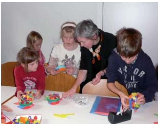
Fotos vom erfolgreichen Kinderkirchenlager der Herbstferien 2008