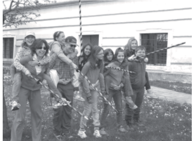
Ritterspiele aus dem Jahr 1083

Am Freitagabend, dem 28. Mai 2010, fanden sich Eltern und alle Lagerteilnehmer zu einem Lagernachtreffen, im katholischen Pfarreizentrum Davos Platz, ein. An diesem regnerischen Abend gab es nochmals die Gelegenheit in Form einer Fotopräsentation mit alten und neu dazu gewonnenen Freunden, das Erlebte nochmals miteinander zu teilen. Bereits nach dem ersten Bild war das Lager in allen jungen Köpfen wieder präsent und löste spontanen Applaus und den einen oder anderen herzhaften Lacher aus. So schwelgte man an diesem Abend miteinander in den Erinnerungen des Pfarreilagers.