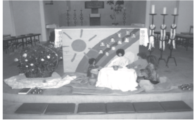
Altardekoration in der Herz-Jesu-Kirche

Gott gebe Dir für jeden Sturm einen Regenbogen, für jede Träne ein Lachen für jede Sorge eine Aussicht und eine Hilfe in jeder Schwierigkeit. Für jedes Problem, das das Leben schickt, einen Freund, es zu teilen, für jeden Seufzer ein schönes Lied und eine Antwort auf jedes Gebet.