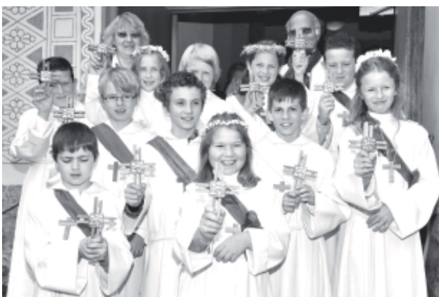
Erstkommunikanten Davos Dorf

Gott gebe Dir für jeden Sturm einen Regenbogen, für jede Träne ein Lachen für jede Sorge eine Aussicht und eine Hilfe in jeder Schwierigkeit. Für jedes Problem, das das Leben schickt, einen Freund, es zu teilen, für jeden Seufzer ein schönes Lied und eine Antwort auf jedes Gebet.