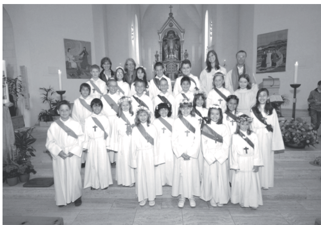
Erstkommunikanten Davos Platz

Die diesjährige Erstkommunion vom Platz und Dorf fand am 30. Mai 2010 unter dem Symbol Regenbogen statt. Dankbar blicken wir auf ein gelungenes Jahr zurück. An den Mittagstischen konnten wir einander begegnen und lernten uns dabei besser kennen. Den Eltern danke ich für ihre Unterstützung, indem sie ihre Kinder immer wieder zum Mitmachen motiviert haben. Es ist nicht selbstverständlich, dass immer so viele Kinder dabei waren. Ebenfalls danken wir den Eltern für die wunderschönen Altarbilder in beiden Kirchen, die sie gemeinsam mit den Erstkommunikanten gestaltet haben.