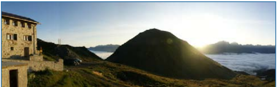
Aussicht von Ziteil Richtung Savognin

Für die Fahrt nach Muntér bitten wir die Teilnehmer, Fahrgemeinschaften zu bilden.